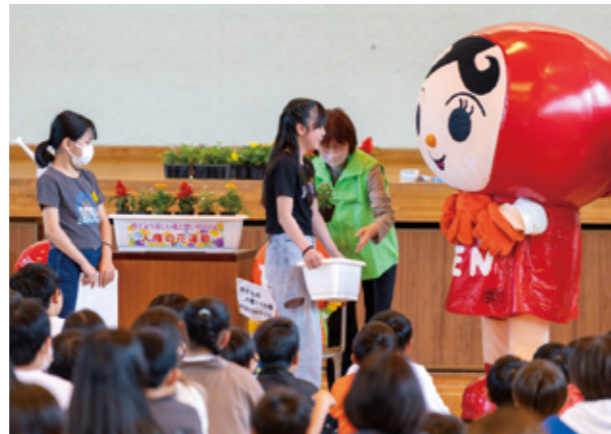
▲プランターを受け取る児童の代表