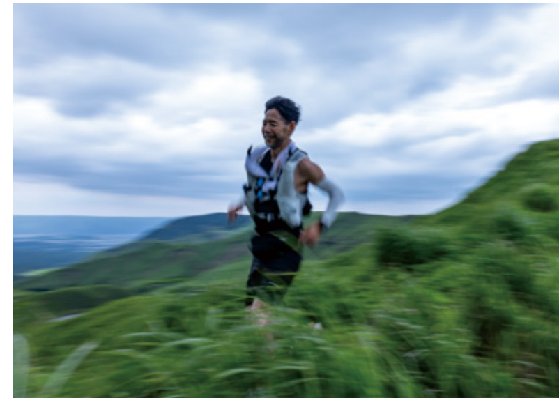
▲草原を走る参加者（左）坂梨公民館でおにぎりを受け取る参加者（右上）坂梨公民館で休憩する参加者（右下）

5月11日、山や草原などの未舗装路を走るトレイルランニングの大会「ASO VOLCANO TRAIL」が開催されました。ASO MILK FACTORYから南阿蘇村のアスペクタまで、約112キロメートルのコース。472人がエントリーし、390人が完走しました。