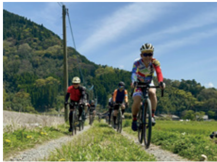
グラベルライドのようす

A SO田園空間博物館(道の駅阿蘇)は「わたしたちの住む地域の価値を再発見し、阿蘇を訪れる人々と一緒に、地域の新しい未来を創造していく」という理念のもと、市民の皆さまと連携しながらさまざまな活動を行っています。その環として、4月22日の「道の駅の日」にちなみ道の駅阿蘇周辺の清掃活動・植栽美化活動を行いました。「道の駅の日」は、1993年4月22日に第1回登録として、全国103の道の駅が登録されたことなどから制定されました。