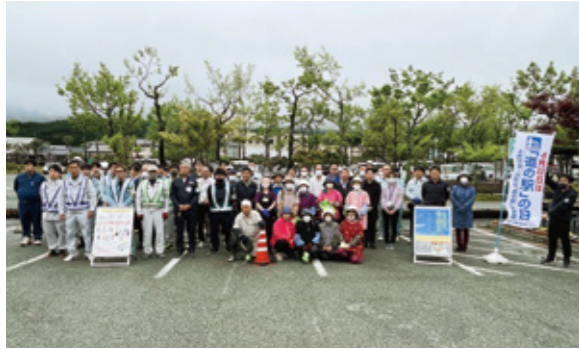
▲ 清掃の参加者 清掃のようす ▶