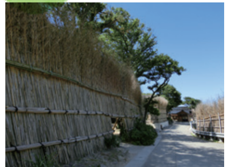
大沢・上大沢の間垣集落景観（石川県輪島市）