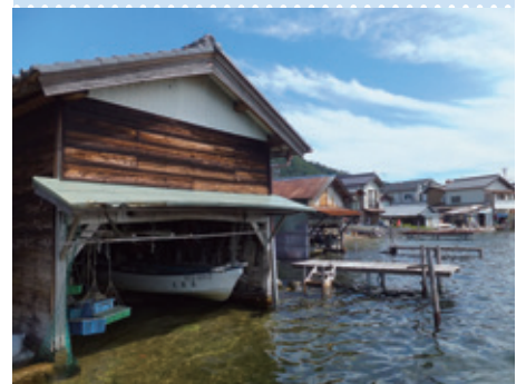
宮津天橋立の文化的景観（京都府宮津市）