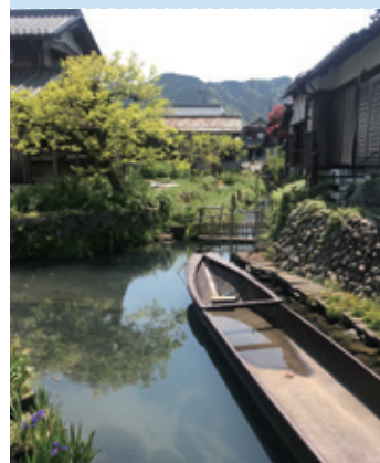
伊庭内湖の農村景観（滋賀県東近江市）