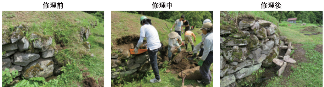
小菅の里及び小菅山の文化的景観（長野県飯山市）