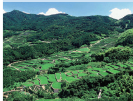
蕨野の棚田（佐賀県唐津市）