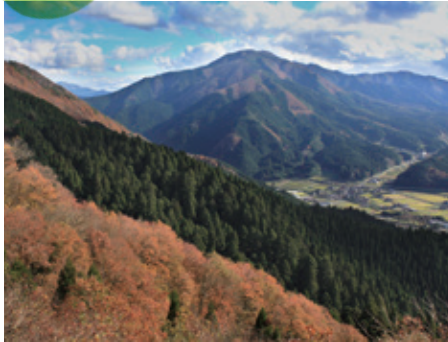
智頭の林業景観（鳥取県智頭町）