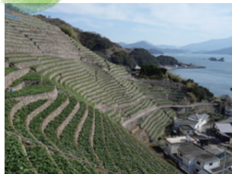
遊子水荷浦の段畑（愛媛県宇和島市）