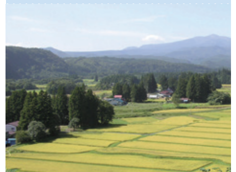
一関本寺の農村景観（岩手県一関市）