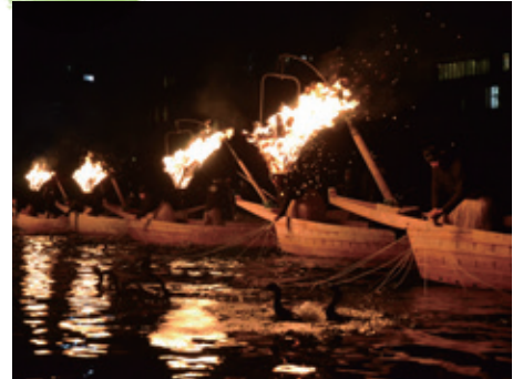
長良川中流域における岐阜の文化的景観（岐阜県岐阜市）