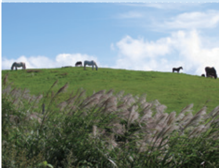
遠野 荒川高原牧場 土淵山口集落（岩手県遠野市）