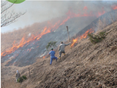
阿蘇の文化的景観 阿蘇北外輪山中央部の草原景観（熊本県阿蘇市）