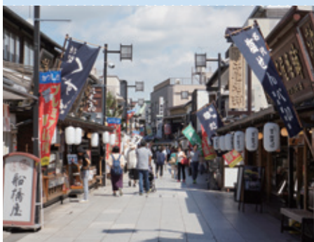
葛飾柴又の文化的景観（東京都葛飾区）