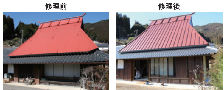
蘭島及び三田・清水の農山村景観（和歌山県有田川町）