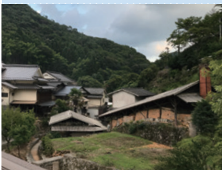
小鹿田焼の里（大分県日田市）