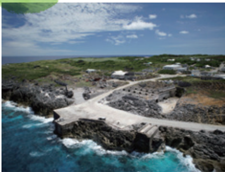
北大東島の燐鉱山由来の文化的景観（沖縄県北大東村）