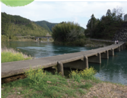
四万十川流域の文化的景観 中流域の農山村と流通・往来（高知県四万十町）