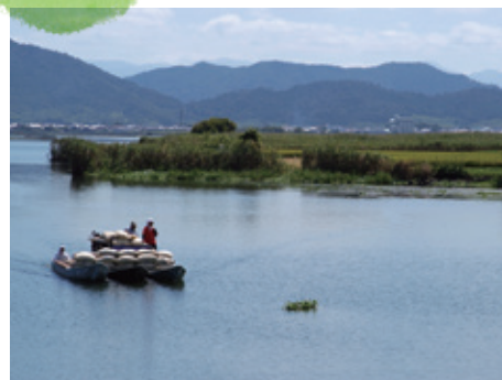
近江八幡の水郷（滋賀県近江八幡市）