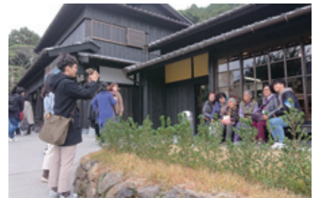
平戸島の文化的景観（長崎県平戸市）