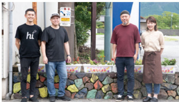
▲内牧温泉街繁栄会のメンバー

人権の花運動の一環として内牧小学校の児童たちによって育てられた花が内牧温泉街に設置されました。人権の花運動は、学校に花の種子や球根などを配布し、児童たちが協力し育てることによって、優しさと思いやりの心を育んでもらうものです。