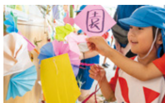
▲ササを飾る園児たち

6月26日、七夕に合わせYMCA黒川保育園の年長児21人が道の駅阿蘇でササを飾り付けました。