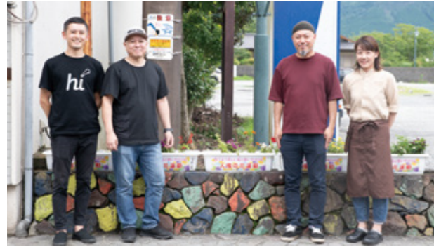
▲内牧温泉街繁栄会のメンバー

人権の花運動の一環として内牧小学校の児童たちによって育てられた花が内牧温泉街に設置されました。人権の花運動は、学校に花の種子や球根などを配布し、児童たちが協力育てることによって、優しさと思いやりの心を育ててもらうものです。