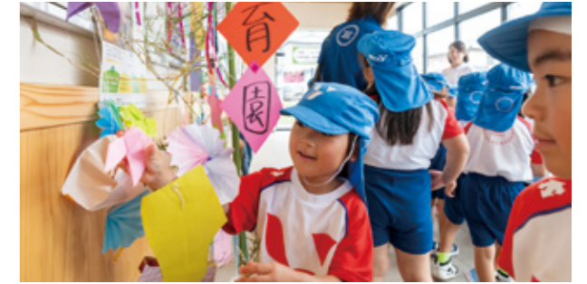
▲ササを飾る園児たち

6月26日、七夕に合わせYMCA黒川保育園の年長児21人が道の駅阿蘇でササを飾り付けました。