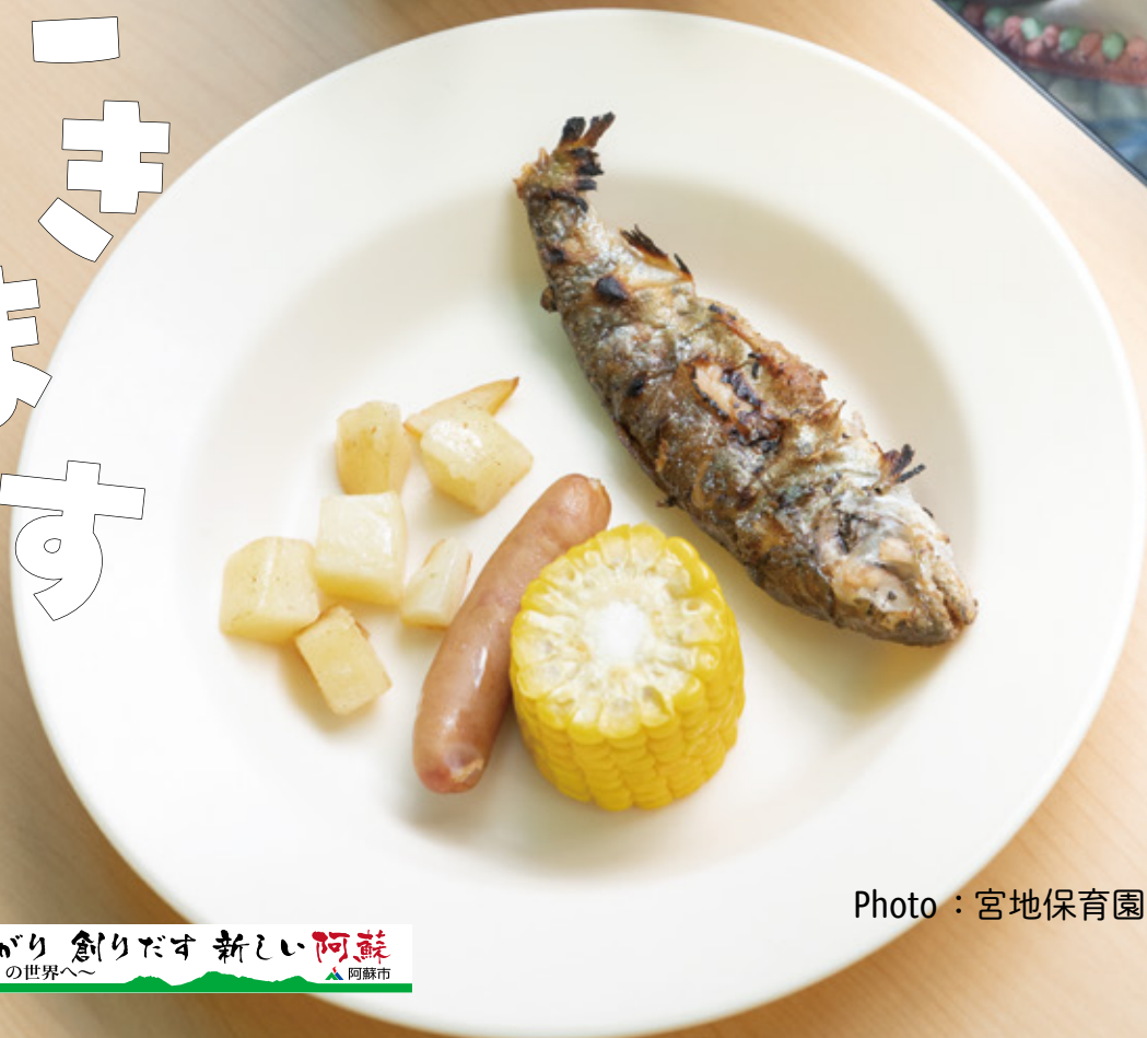
Photo : 宮地保育園の野外活動