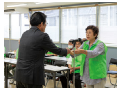
▲副市長にメッセージが伝達された

7月1日、「社会を明るくする運動」強化月間に合わせ、内閣総理大臣と熊本県知事からのメッセージが、阿蘇中部地区推進委員会から副市長に伝達されました。この運動は、犯罪や非行の防止と立ち直りについて理解を深め、明るい社会を築くために全国で行われています。