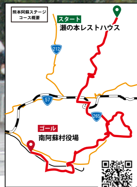
詳しいコースはこちら