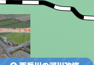
⑥ 西岳川の河川改修