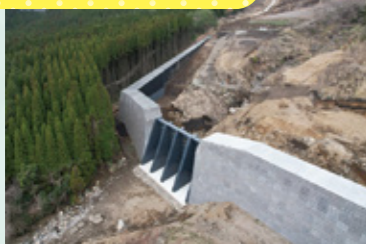
③ 上の小屋川2砂防堰堤