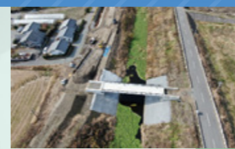
⑬ 宮原川の改修に伴う黒橋の架替