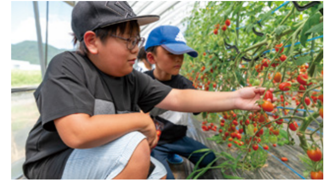
▲トマトを収穫する児童

7月31日、一の宮小学校の一の宮まどか学童クラブの3年生19人と4年生5人が市内のビニールハウスを訪れ、トマトの収穫を体験しました。