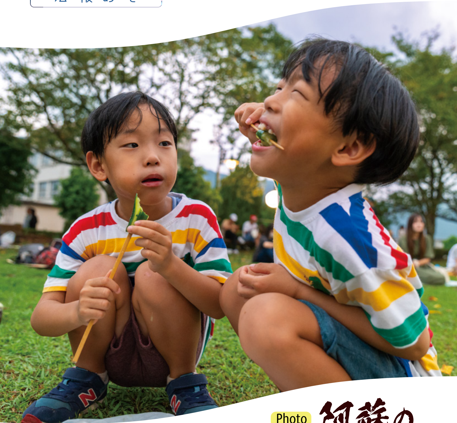
Photo 阿蘇の 夏まつり