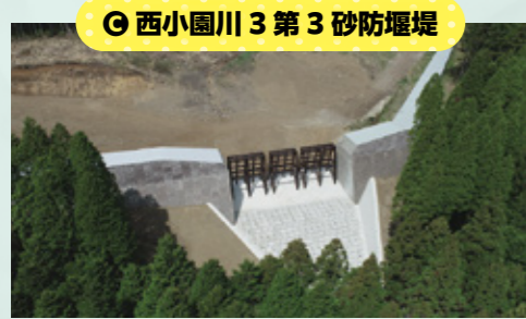
⑨ 西小園川3第3砂防堰堤