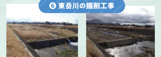
⑥ 東岳川の掘削工事