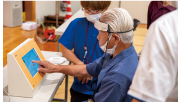
▲認知機能の検査を体験する参加者

7月31日、熊本トヨタ自動車株式会社と損害保険ジャパン株式会社によるサロンリーダー向け研修が阿蘇保健福祉センターでありました。