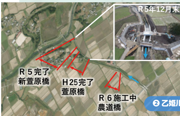
② 乙姫川の河川改修・橋の架替工事