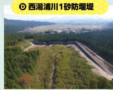
⑩ 西湯浦川1砂防堰堤