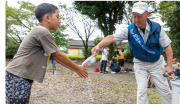
▲冷たい水を提供するロータリークラブのメンバー

小中学生が大分市から熊本市までを7日間かけて歩く「参勤交代・九州横断徒歩の旅」が開催されました。