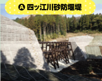
④ 四ツ江川砂防堰堤