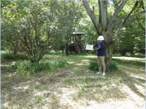
森林教育の森管理