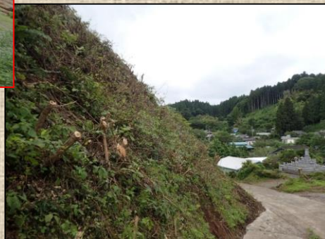
森林環境整備事業（危険木伐採）