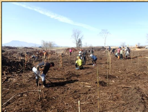
森林環境教育：植林体験・丸太アート

森林環境教育を通じて森林整備の必要性や木材利用について理解と関心を深めるための普及啓発を支援。