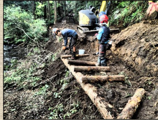
森林作業道等整備事業

森林作業道等整備事業：森林整備及び木質資源の有効活用を目的とした森林作業道等の開設、または自然災害等で被災した森林作業道等の修繕を対象に支援する。