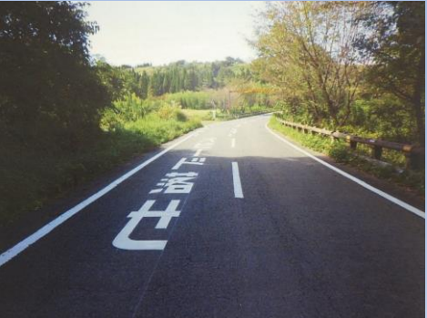
林道維持管理（区画線・注意表示）