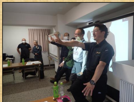
会員事業体研修会

協議会の会員でもある林業経営体と専門的なアドバイザーを招き定期的な研修と同時に意見交換を行い現場の声を聴き、実情を把握するとともに必要となる事業の展開を検討して創設。このことにより、状況に応じた事業への転換などさらなる森林譲与税の活用が見込まれる。