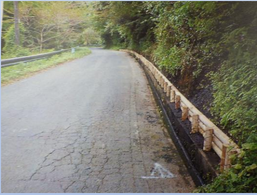
木材を利用した土砂流出防止