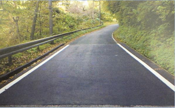
林道維持管理（舗装改修）