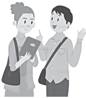
多言語対応タブレットの活用

健康増進課長 外国人の方へ母子手帳の交付や家庭訪問の際に31か国語に対応可能な翻訳機能を利用し、円滑な意思疎通を図るための活用を考えています。