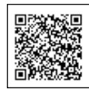
詳しくは市ホームページ

令和7年4月以降に申請した場合は、申請した翌月分から拡充分を支給します。申請が遅れた月分の児童手当は支給できませんの早めに申請してください。