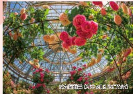
はな阿蘇美 (ASO MILK FACTORY)