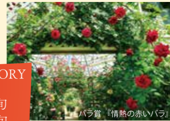
バラ賞 『情熱の赤いバラ』

場所：ASO MILK FACTORY (はな阿蘇美) 見頃：4月下旬～6月上旬 10月中旬～11月中旬