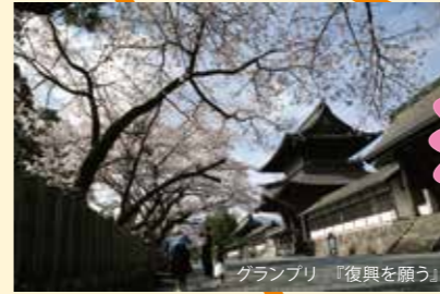
グランプリ 『復興を願う』