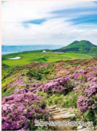
鳥籠子島から見た草千里ヶ浜

波野のそば畑では、700万本のそばの花が一斉に咲き誇り、白のじゅうたんを敷いたような風景を楽しめます。