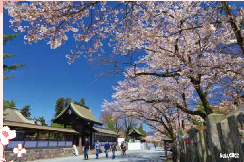
阿蘇神社 審査員特別賞 『復興の桜』