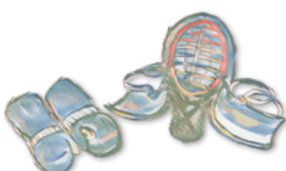
先生からのコメント

と思っていました。私は剣道をしており、祖父のもとで習ってきました。祖父はいつも私に、「おまえの剣道は汚い、今の時代の剣道では大人になって通用しない。」と言います。「汚い」というのは、姿勢や形の面、そして「勝ちにこだわらずすぎる」ということです。私は、(つるさじ)(勝てたらいいじゃん)などと思いつつ、今の人と昔の人とは考えは違うし、聞いていても無駄だと思っていました。