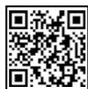
「おたより」 フォーム